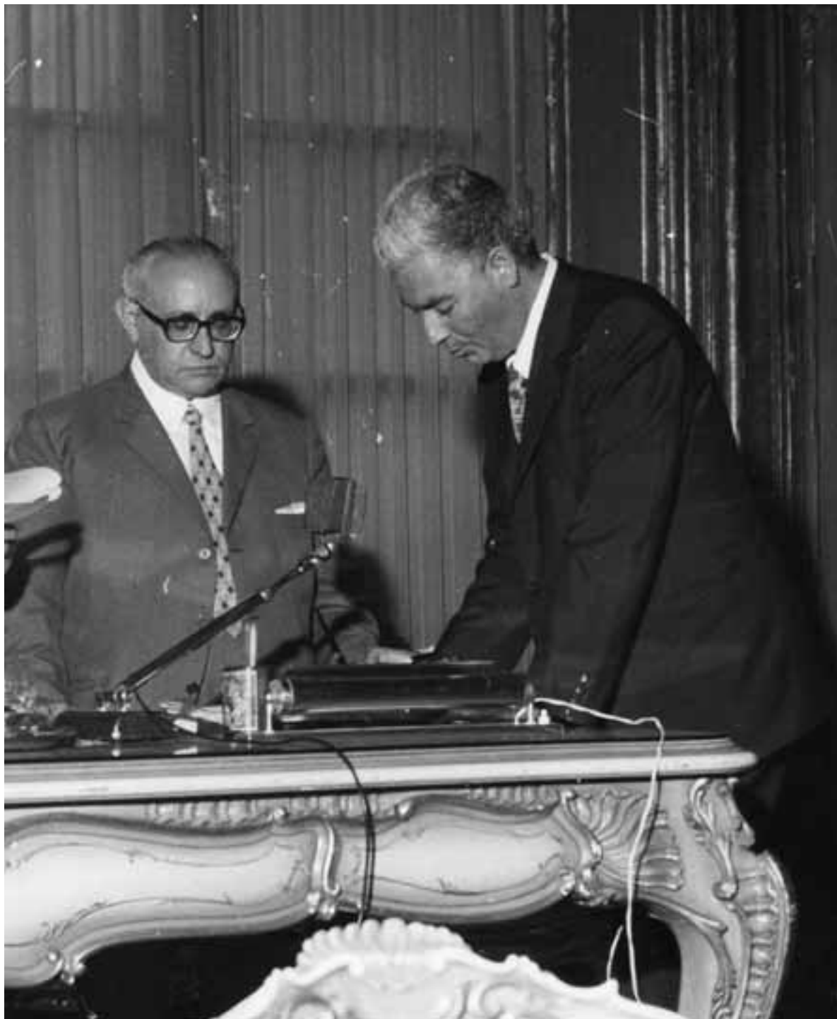
Il giuramento nella Sala Martorana di Palazzo Comitini

Ma la sua grande passione è la politica, viene eletto negli anni '60 consigliere comunale, diviene assessore e infine Vice sindaco di Bagheria. Componente del consiglio d'amministrazione dell'A.S.I.